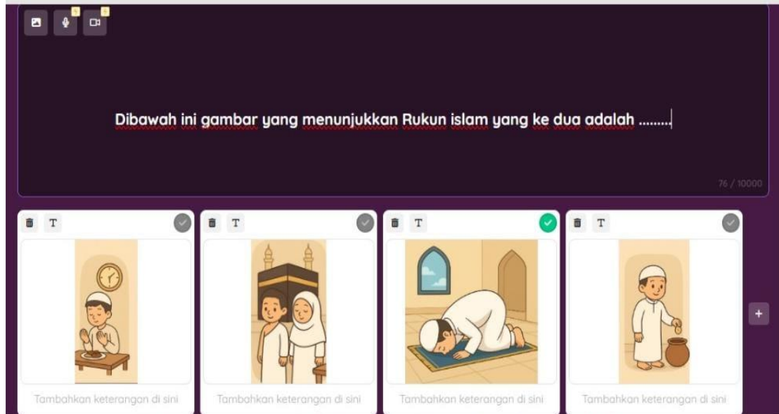
Gambar 3. Tampilan Sebelum Revisi Background

Berdasarkan Gambar 1 dan Gambar 2 di atas, terlihat bahwa telah dilakukan perubahan pada jenis dan ukuran font agar lebih mudah dibaca oleh siswa. Sebelum revisi, font yang digunakan cenderung kecil dan kurang menarik perhatian. Setelah revisi, font diperbesar dan dipilih jenis font yang lebih jelas dan ramah bagi siswa.