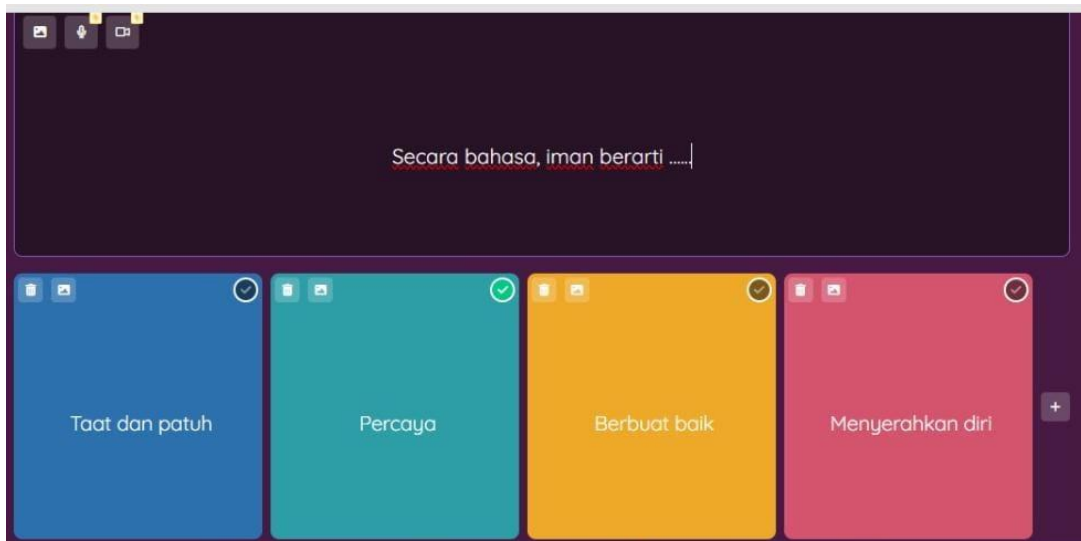
Gambar 1. Tampilan Sebelum Revisi Font

Setelah produk selesai dikembangkan dan direvisi sesuai dengan masukan dari ahli media maupun ahli materi, peneliti kemudian menampilkan beberapa tampilan layout yang telah diperbaiki berdasarkan hasil validasi kedua ahli tersebut. Berikut ini merupakan gambaran layout media Quizizz sebelum dan setelah melalui proses revisi: