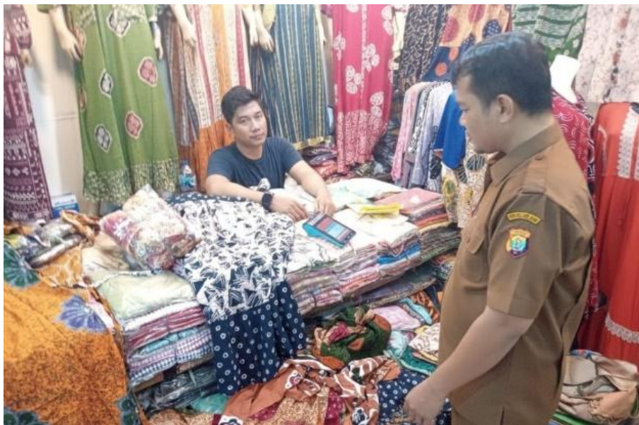
Gambar 2. Petugas Retribusi Turun ke Lapangan

Selain kendala teknis, faktor kondisi pedagang juga mempengaruhi kelancaran pemungutan retribusi. Beberapa pedagang tidak dapat membayar tepat waktu dengan alasan usaha menurun, toko belum beroperasi, atau pemilik tidak berada di tempat. Kondisi ini mempersulit petugas dalam melakukan penagihan secara rutin, sebagaimana didukung oleh dokumentasi lapangan