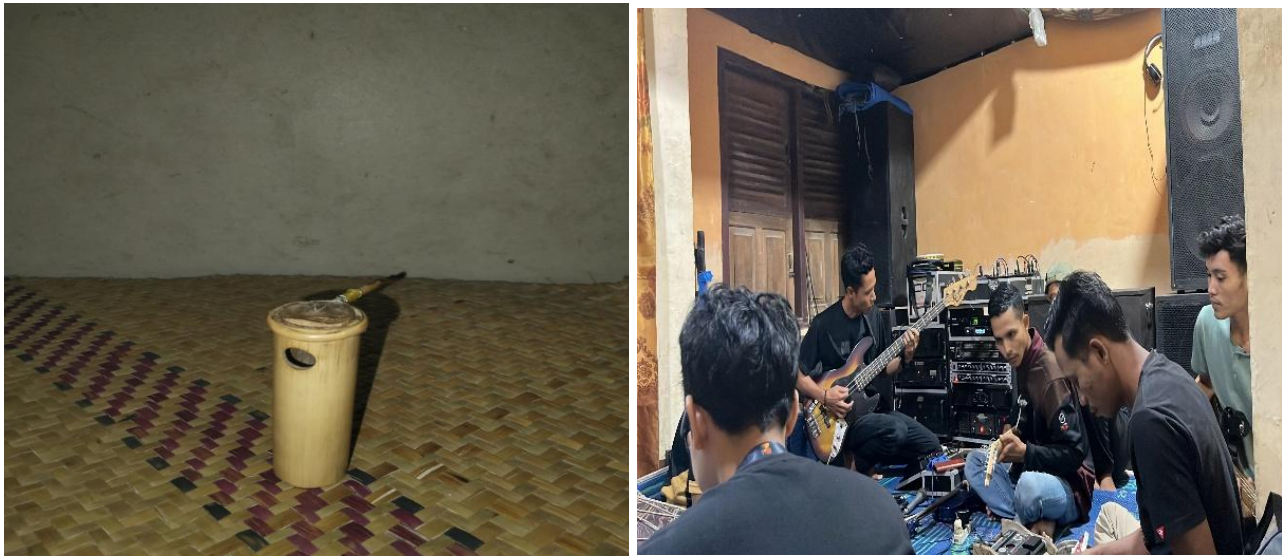
Gambar 3: Kolaborasi Tkud dengan Instrumen Modern