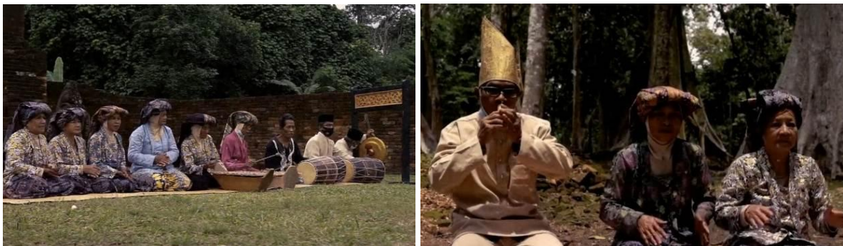
Gambar 1. Pertunjukan Kesenian Gambang dalam Acara Budaya di Desa Danau Lamo

Selain perubahan bentuk penyajian, data lapangan menunjukkan adanya aktivitas pelestarian yang dilakukan oleh KKS secara berkelanjutan. Aktivitas tersebut meliputi pembinaan kepada anggota keluarga yang lebih muda, pendokumentasian repertoar lagu, serta keikutsertaan dalam kegiatan budaya tingkat desa dan daerah. Dokumentasi visual pertunjukan kesenian Gambang dalam konteks acara budaya ditunjukkan pada Gambar 1.