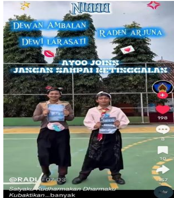
Gambar 3 Konten Siswa Menggunakan Backsound Lagu Dangdut