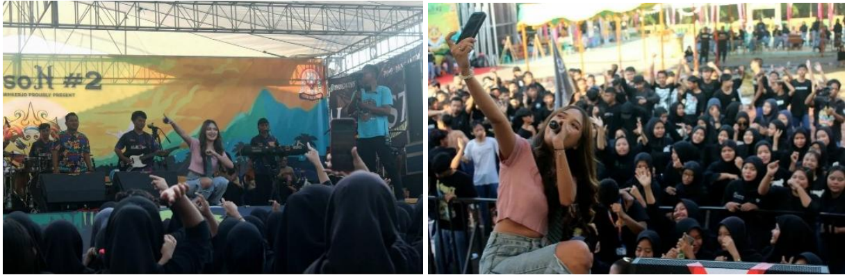
Gambar 4 Konser Dangdut Alrosta saat HUT SMA Negeri Kerjo