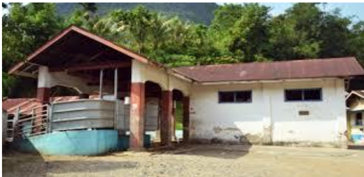
Gambar 4. Rumah Pemetongan Hewan Museum Goedang Ransoem

Rumah jagal (potong hewan), dari sinilah kebutuhan daging yang masak dapur umum dipasok.