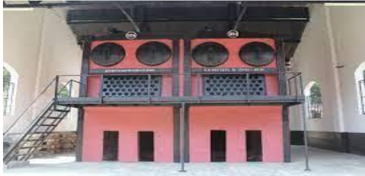
Gambar 3. Tungku Pembakaran Museum Goedang Ransoem Sawahlunto

Tungku pembakaran (steam generator) sebagai sumber energi uap panas untuk memasak. Uap panas disalurkan pipa-pipa melewati ruang bawah tanah. Tungku pembakaran ini buatan Jerman bertahun 1894