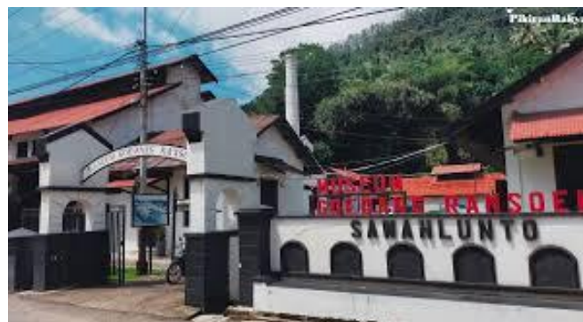
Gambar 2. Bangunan Museum Goedang Ransoem Sawahlunto

Kontruksi utama merupakan ruangan pameran utama Museum Goedang Ransoem yang menyajikan dan memamerkan benda koleksi yang merupakan eks-peralatan dan perlengkapan dapur umum. Peralatan masak yang serba luhur dapat disaksikan di sini dengan sistim masak uap panas dari steam generator yang unik.