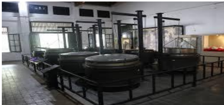
Gambar 6. Periuk Nasi Museum Goedang Ransoem

Periuk pemasak beras dan sayur ini berdiameter 124 cm hingga mencapai 132 cm, badan periuk setinggi 60 cm hingga 62 cm (belum termasuk tutupnya) dan tebal 1,2 cm. Periuk raksasa ini terdiri dari empat bagian: lapisan luar periuk, periuk anggota dalam terbuat dari nikel, langsung juga terbuat dari nikel, tutup.