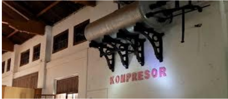
Gambar 5. Kompresor Museum Goedang Ransoem