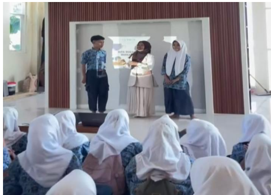
Gambar 2. Praktik Simulasi Deteksi Hoaks oleh Siswa SMP dalam Kegiatan Edukasi Literasi Digital

tidak langsung melatih keterampilan berpikir kritis sekaligus menanamkan sikap kehati-hatian dalam mengonsumsi dan membagikan informasi daring.