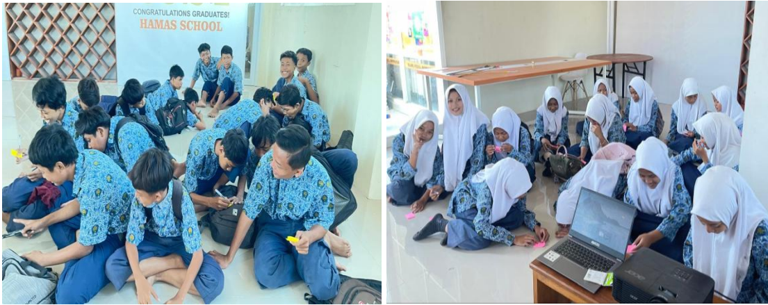
Gambar 3. Diskusi Etika Digital: Siswa Menganalisis Dampak Sosial dari Konten yang Tidak Terverifikasi

Respons siswa terhadap konten hoaks dirangkum dalam tabel berikut: