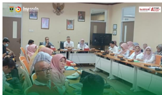
Gambar 1. Rapat Koordinasi ETPD di BAPENDA Kota Padang

Hasil penelitian menunjukkan bahwa proses komunikasi menjadi faktor penting dalam keberhasilan implementasi ETPD. Komunikasi dilakukan secara bertahap melalui koordinasi internal di BAPENDA, dilanjutkan ke petugas pajak, hingga kepada wajib pajak melalui berbagai media. Proses transmisi pesan kebijakan disampaikan secara rutin melalui rapat koordinasi dengan Bank Indonesia.