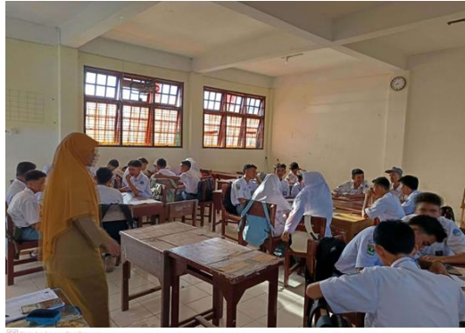
Gambar 1. Siswa dibagi sesuai gaya belajar