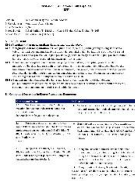
Gambar 1 Rancangan Perencanaan Pembelajaran

Beberapa pemaparan diatas juga dikuatkan oleh dokumentasi yang peneliti lakukan mengenai RPP yang dibuat oleh guru PAI seperti pada gambar berikut: