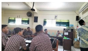
Gambar 2 Penguasaan Pembelajaran

Pemaparan di atas diperkuat dengan observasi peneliti mengenai penguasaan pembelajaran oleh guru PAI sebagaimana gambar berikut: