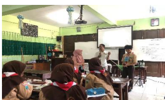
Gambar 4 Pembelajaran PAI berbasis digital

Pemaparan di atas dikuatkan oleh observasi peneliti mengenai penggunaan teknologi dalam pembelajaran sebagaimana gambar berikut: