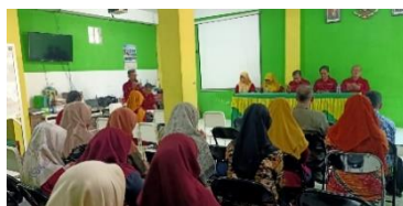
Gambar 5 Pelatihan Guru

Pemaparan di atas diperkuat dengan hasil observasi peneliti mengenai adanya pelatihan guru untuk meningkatkan kompetensi yang dimiliki sebagaimana gambar berikut: