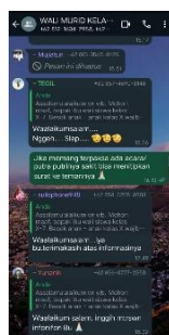
Gambar 3 Grup Whatsapp Guru dan Wali Murid (BK/RM1/O/SN/17/06/2024)

Pernyataan diatas diperkuat dengan adanya grup whatsapp antara guru dan wali murid sebagaimana gambar berikut: