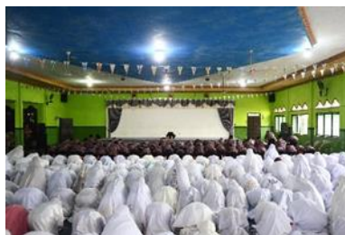
Gambar 6 Kegiatan Sholat Berjama'ah (SW2/RM2/O/RB/19/06/2024)

Pembentukan karakter disiplin siswa SMA Wahid Hasyim II Taman Sidoarjo didukung oleh beberapa faktor. Faktor yang memengaruhi berasal dari dalam diri peserta didik maupun dari faktor luar. Salah satu faktor pendukung dalam pembentukan karakter disiplin siswa salah satunya didukung oleh adanya peraturan sekolah. Hal ini seperti yang disampaikan oleh pak Amir. Beliau mengutarakan: