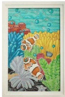
Gambar 5. Pancarona