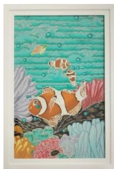
Gambar 3. Togetherness