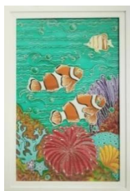
Gambar 8. Harmoni Lautan