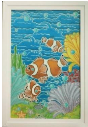
Gambar 9. Harsa