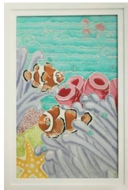
Gambar 4. Camaraderie