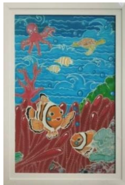
Gambar 6. Penjaga Anemon

Judul : Penjaga Anemon Media : Kain Mori Primissima Ukuran : 40 cm x 60 cm Teknik : Batik Lukis Tahun : 2025