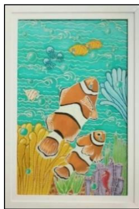
Gambar 7. Penjaga Kecil