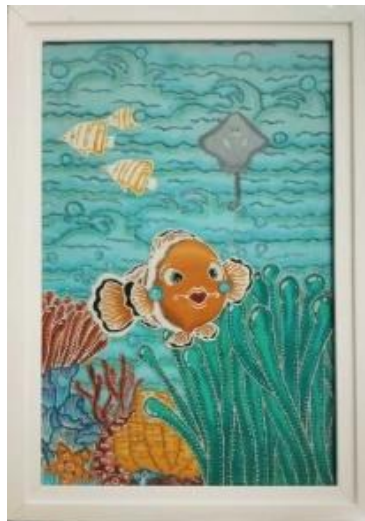
Gambar 1. Finding Haven