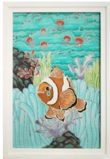
Gambar 2. Rumah