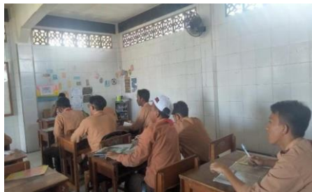
Gambar 1 Diskusi dan tanya Jawab.

Hasil Wawancara diatas di perkuat dengan hasil observasi peneliti melihat siswa-siswi sebagai berikut :