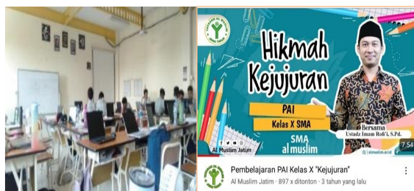
Gambar 4 Infrastruktur Sekolah dan Konten Video PAI

Faktor pendukung utama dalam implementasi PAI berbasis literasi digital di SMA Al-Muslim Sidoarjo meliputi beberapa aspek penting. Ketersediaan akses internet yang stabil menjadi pondasi utama yang memungkinkan proses pembelajaran berbasis digital berjalan lancar. Selain itu, peran aktif guru serta kompetensi mereka dalam memanfaatkan Learning Management System (LMS) menjadi kunci keberhasilan, di mana para guru mampu mengoptimalkan teknologi untuk menciptakan pengalaman belajar yang efektif dan interaktif. Dukungan sekolah dalam pembuatan konten, seperti video pembelajaran, juga berperan signifikan dalam memastikan bahwa media pembelajaran yang dihasilkan berkualitas tinggi dan menarik bagi para siswa, sehingga mampu meningkatkan minat dan pemahaman mereka terhadap materi PAI. Fasilitas pembelajaran yang memadai seperti peralatan komputer, LCD dan Wifi dalam mendukung proses pembelajaran yang efektif dan efisien, khususnya dalam pembelajaran. Ditemukan dari hasil observasi yang telah dilaksanakan oleh peneliti ditemukannya faktor pendukung PAI berbasis literasi digital di SMA Al-Muslim Sidoarjo adalah Ketersediaan akses internet yang stabil, peran aktif guru dan kompetensi mereka dalam memanfaatkan LMS, dukungan sekolah dalam pembuatan konten, seperti video, memastikan bahwa media pembelajaran yang dihasilkan berkualitas dan menarik.