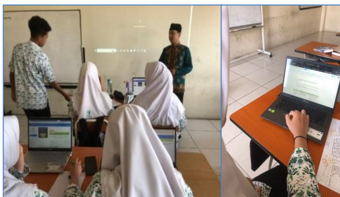
Gambar 2 Penerapan Teknologi Digital Di Kelas

Memperkuat pernyataan di atas, ditemukan dari hasil observasi yang telah dilaksanakan oleh peneliti ditemukannya penerapan teknologi digital dalam kelas saat mengajar PAI sekolah menggunakan aplikasi My Al Muslim sebagai platform utama dalam kegiatan pembelajaran PAI, kedua kesiapan infrastruktur dan perangkat, ketiga siswa memanfaatkan media digital untuk presentasi dan diskusi, sementara guru memberikan bimbingan dan penguatan materi.