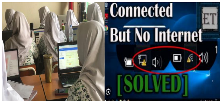
Gambar 5 Wifi No Inet Access