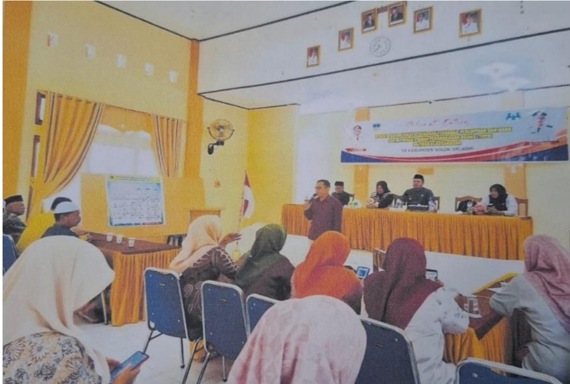
Gambar 1. Sosialisasi Pencegahan Kekerasan terhadap Anak Tingkat Kecamatan