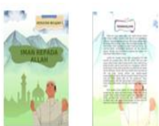
Gambar 2 Tampilan Salah Satu Sampul dan Pendahuluan dalam Kegiatan Belajar I

kompetensi atau sub kompetensi menjadi kesatuan yang sistematis. Beberapa tahapan dalam melakukan desain SMART Modul PAI diantaranya, tahap perencanaan, tahap pertama dari desain modul adalah merencanakan seperti apa modul yang akan dibuat. Tahap ini akan menghasilkan Garis Besar Isi Modul. Garis Besar Isi Modul adalah cetak biru dari modul yang akan ditulis, membuat judul atau identitas, membuat pokok bahasan atau sub pokok bahasan tujuan pembelajaran, pokok-pokok materi, penilaian dan kepustakaan. Dalam mendesain SMART Modul langkah yang ditempuh peneliti selanjutnya adalah tahap penulisan, setelah diperoleh Garis Besar Isi Modul selanjutnya adalah proses penulisan modul. Penulisan modul menggunakan Microsoft Word 2019. Aplikasi selain Microsoft Word 2019 yang digunakan peneliti dalam membuat modul adalah Canva. Canva digunakan untuk membuat desain visual baik sampul maupun konten media, Desain yang dibuat adalah sampul, identitas modul, Kata pengantar, daftar Isi, deskripsi, dan prolog, petunjuk penggunaan QR Code dalam Modul, capaian pembelajaran, materi pokok, mutiara hikmah, SMART Activity, SMART Information, mari bermuhasabah, rangkuman, evaluasi diri, glosarium, kunci jawaban, daftar referensi dan biodata penulis.