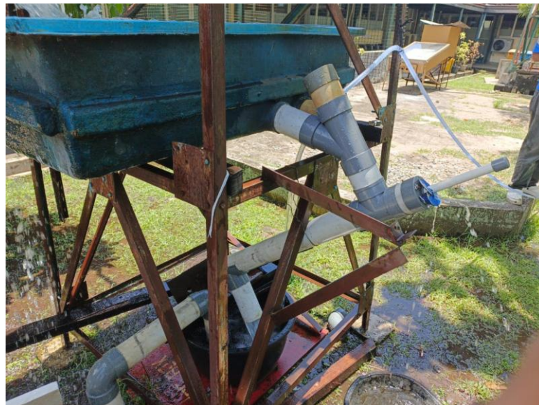
Gambar 2. Turbin archimedes

Alat turbin archimedes diapasang pada bak penampung dengan kemiringan 45^\circ yang dimana screw turbin berputar karena aliran air yang berasal dari bak penampung atas yang dialirkan pada bak penampung bawah, yang dimana air pada bak penampung bawah dialirkan kembali pada bak penampung atas, sehingga turbin archimedes akan berputar terus.