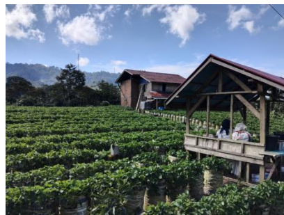
Gambar 9. Fasilitas pondok dan tempat berteduh di kebun Melky

Meskipun konsep petik sendiri telah diterapkan, fasilitas yang tersedia di Kebun Stroberi Melky masih sangat terbatas. Beberapa diantaranya seperti toilet yang bersifat seadanya, tidak terdapat fasilitas makan atau kantin, belum tersedia tempat cuci tangan, papan informasi edukatif, atau jalur wisata yang teratur di dalam kebun. Kebun Stroberi Melky hanya memiliki 1 pondok yang digunakan untuk istirahat pekerja, disanalah toilet dan juga tempat shalat berada, jika pengunjung ingin ke toilet, maupun menumpang shalat bisa masuk ke dalam pondok tersebut.