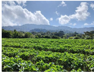
Gambar 1. Panorama Kebun Stroberi Melky

Menurut Gunawan (2016), daya tarik utama destinasi wisata pedesaan terletak pada keaslian lingkungan, kenyamanan suasana, dan keunikan budaya lokal.