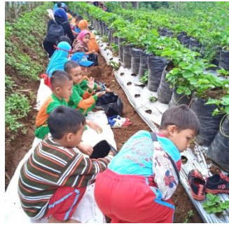
Gambar 7. Kegiatan Petik Sendiri TK Kasih Ibu