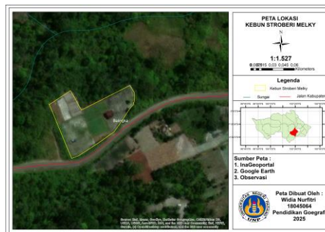
Gambar 2. Luas Kebun Stroberi Melky

Kebun Stroberi Melky sendiri memiliki lahan yang cukup luas dibandingkan dengan kebun stroberi lain disekitarnya. Dari penelitian yang dilakukan kebun ini memiliki luas sekitar 10.000 m 2 atau setara dengan 1 Ha, dengan lebih kurang 7.500 media tanam karung, serta jumlah produksi perbulannya mencapai 500 kg.