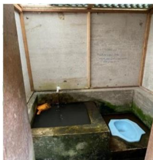
Gambar 10. kondisi toilet di kebun melky