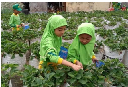
Gambar 6. Kegiatan Petik Sendiri TK Al-Isyad Pahambatan

Menurut Cahyadi dan Gunawan (2021), wisata edukatif merupakan bentuk pembelajaran kontekstual yang sejalan dengan implementasi Kurikulum Merdeka dan program P5.