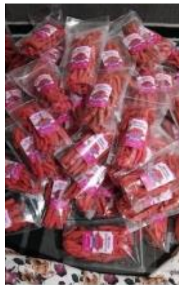
Gambar 4. Olahan buah stroberi menjadi cemilan sehat

Pemilik kebun stroberi melky bersama pemilik kebun stroberi lain yang memiliki lahan membentuk sebuah rumah produksi kecil yang bernama Hishan Stroberi di rumah produksi inilah mereka melakukan produksi stik buah stroberi, sabun mandi, dan juga selai stroberi. Namun yang menjadi kendala adalah produksi produk turunan (hilirisasi) ini tidak dilakukan setiap hari, namun hanya saat hari-hari besar saja seperti saat lebaran idul fitri mereka baru membuat produk stik stroberi dan juga milkshake, karena saat hari-hari besar seperti itu banyak permintaan dari warga sekitar.