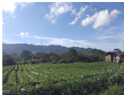
Gambar 3. Peta delineasi kebun stroberi melky