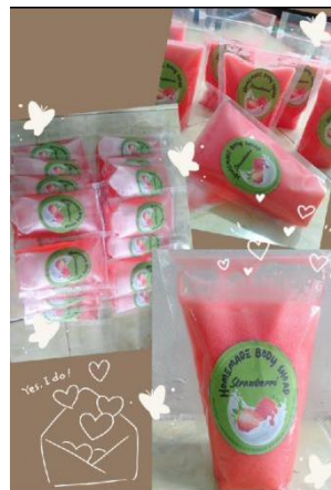
Gambar 5. Olahan buah stroberi menjadi sabun mandi cair