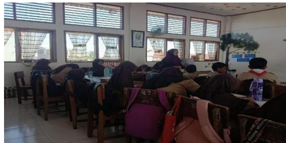
Gambar 4 Pengerjaan Posttest

Pada pertemuan keempat ini peneliti meminta siswa untuk mengerjakan soal pretest sebagai tes akhir, soal pilihan ganda dan essay, waktu pengerjaan selama 45 menit.