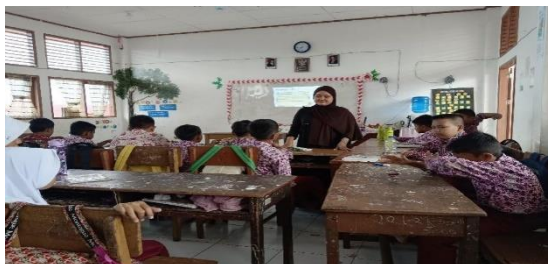
Gambar 2 Pretest Team Games Tournament

Pada pertemuan kedua, peneliti menjelaskan mengenai metode Team Games Tournament , apa itu metode Team Games Tournament , bagaimanakah cara pembelajaran menggunakan metode Team Games Tournament . Selanjutnya barulah peneliti menyampaikan materi menggunakan infocus disertai dengan gambar-gambar animasi agar siswa lebih paham mengenai materi yang dijelaskan, gambar-gambar animasi tersebut juga bertujuan untuk membuat siswa lebih semangat dan tidak merasa bosan saat pembelajaran berlangsung.