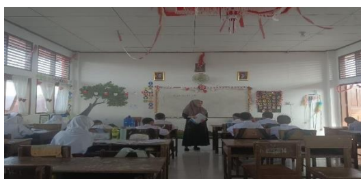
Gambar 7 Pertemuan Kedua Menggunakan Metode Ceramah

Pada pertemuan ketiga peneliti menjelaskan materi yang belum selesai dijelaskan pada pertemuan kedua. Materi yang dibahas pada pertemuan ini adalah materi point ketiga, yaitu hikmah beriman kepada hari akhir. Setelah menjelaskan semua materi siswa dipersilahkan untuk bertanya jika ada yang kurang paham mengenai materi yang telah dipaparkan.