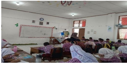
Gambar 3 Penerapan Metode Team Games Tournament

Pada pertemuan keempat ini peneliti meminta siswa untuk mengerjakan soal pretest sebagai tes akhir, soal pilihan ganda dan essay, waktu pengerjaan selama 45 menit.