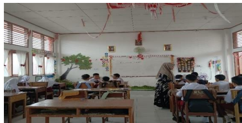
Gambar 5 Pretest Kelas Kontrol

Pertemuan pertama, karena keterbatasan waktu pada pertemuan ini peneliti hanya memberikan soal pretest kepada siswa. Soal pretest berupa soal essay sebanyak 5 soal, dengan waktu pengerjaannya selama 30 menit.