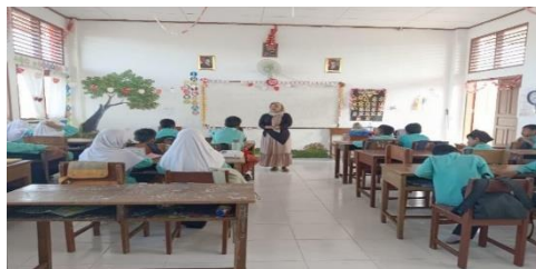
Gambar 6 Penjelasan Materi Menggunakan Metode Ceramah

Pada pertemuan ketiga peneliti menjelaskan materi yang belum selesai dijelaskan pada pertemuan kedua. Materi yang dibahas pada pertemuan ini adalah materi point ketiga, yaitu hikmah beriman kepada hari akhir. Setelah menjelaskan semua materi siswa dipersilahkan untuk bertanya jika ada yang kurang paham mengenai materi yang telah dipaparkan.