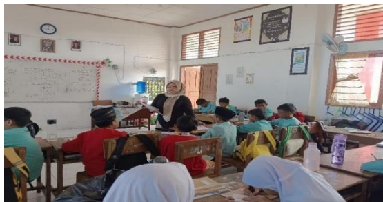
Gambar I. Pelaksanaan Metode Team Games Tournament Kelas Eksperimen

diberikan perlakuan menggunakan metode Team Games Tournament , metode ini diterapkan untuk mengetahui keefektifitasannya terhadap hasil belajar peserta didik.