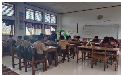
Gambar 8. Post-Test kelas kontrol

Pertemuan keempat, pada pertemuan ini peneliti hanya memberikan soal tes akhir atau disebut posttest. Soal berupa pilihan ganda dan essay, sebanyak 20 soal dengan waktu pengerjaan selama 45 menit.