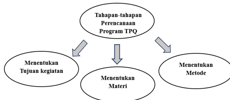
Gambar 2 Tahapan-tahapan Perencanaan Program TPQ di SMP Negeri 18 Padang

Dalam tahapan perencanaan program TPQ dalam meningkatkan kemampuan membaca Al-Qur'an siswa di SMP Negeri 18 Padang ada tiga tahapan, hal ini disampaikan oleh dua guru pembimbing program TPQ di SMP Negeri 18 Padang yaitu Ibu Ekthofia dan Ibu Nurliati beliau menyampaikan tiga tahapan tersebut yakni, Menentukan Tujuan Kegiatan, Menentukan Materi, Menentukan Metode. Lebih jelasnya tahapan-tahapan Perencanaan Program Taman Pendidikan Al-Qur'an (TPQ) dalam Meningkatkan Kemampuan Membaca Al-Qur'an Siswa di SMP Negeri 18 Padang sebagai berikut :