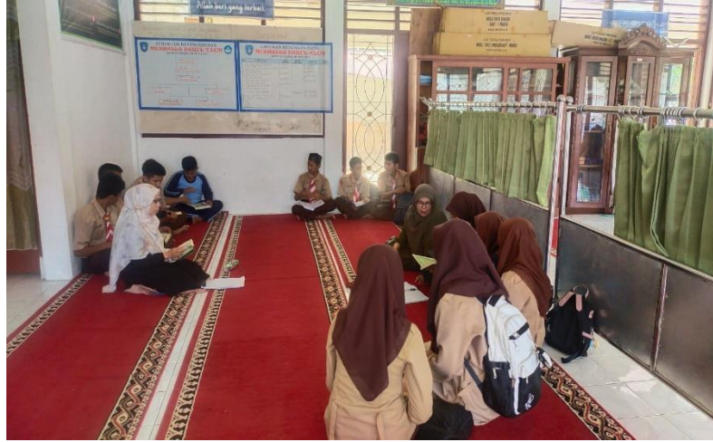
Gambar 1 Kegiatan Program TPQ

dilaksanakan diluar jam pembelajaran. Tujuannya adalah bisa menanggulangi ataupun bisa memperbaiki bacaan Al-Qur'an peserta didik. Kegiatan ini dilaksanakan setiap hari Sabtu sepulang sekolah. Untuk lebih jelas dapat dilihat pada gambar dibawah ini :