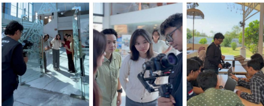
Gambar 1. Proses Pembuatan Pembelajaran Kreatif VPBL

peningkatan besar dan bermakna secara edukatif. Temuan ini menegaskan bahwa VPBL tidak hanya menumbuhkan pembelajaran spesifik bidang, tetapi juga kompetensi kreatif lintas bidang mengintegrasikan keterampilan teknis dengan imajinasi, pemecahan masalah, serta komunikasi ekspresif.