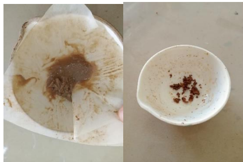
Gambar 4. Hasil pektin basah dan setelah dikeringkan dengan oven

Filtrat pektin diperoleh berwarna kuning kecoklatan yang selanjutnya diendapkan selama 24 jam dengan penambahan etanol 96% dengan rasio volume filtrat dan etanol 1:1.