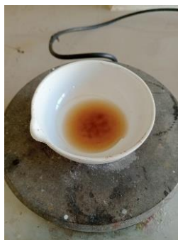
Gambar 6. Uji pembentukan gel pada pektin