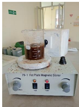
Gambar 2. Proses ekstraksi pektin dari bubuk kulit pisang

Untuk mengekstrak pektin dari bubuk kulit pisang, digunakan metode ekstraksi asam dengan menggunakan asam klorida (HCl) dengan pH 1 yang distirrer selama 1 jam pada suhu 80°C sehingga diperoleh pektin larut pada larutan yang tampak berwarna kecoklatan.