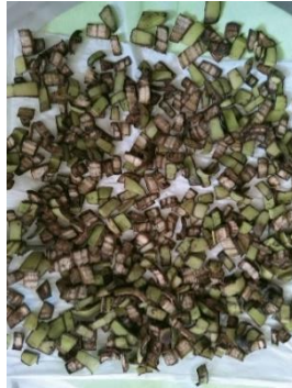
Gambar 1. Proses pengeringan limbah kulit pisang

Proses pemisahan pektin dari kulit pisang diawali dengan tahapan persiapan. Pertama, kulit pisang dicuci bersih untuk menghilangkan segala kotoran atau residu yang menempel. Setelah bersih, kulit pisang dirajang menjadi potongan-potongan kecil. Tujuan perajangan ini adalah untuk memperkecil ukuran partikel, yang secara signifikan akan mempercepat proses pengeringan. Selanjutnya, potongan-potongan kulit pisang tersebut dijemur di bawah sinar matahari langsung selama tujuh hari.