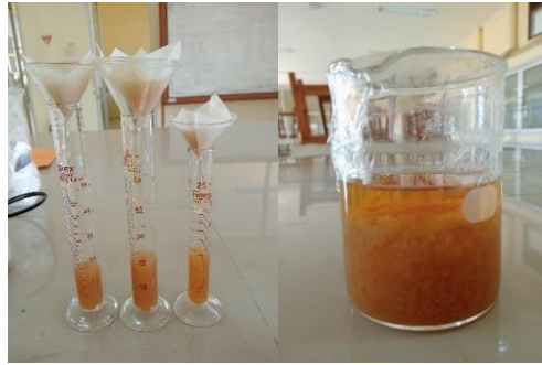
Gambar 3. Pemisahan filtrat dan koagulasi pektin pada filtrat dengan etanol

Filtrat pektin diperoleh berwarna kuning kecoklatan yang selanjutnya diendapkan selama 24 jam dengan penambahan etanol 96% dengan rasio volume filtrat dan etanol 1:1.