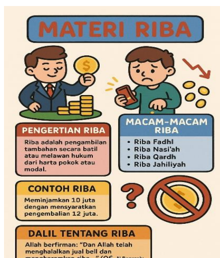
Gambar 3. Poster Materi Riba

dipahami bila desainnya tidak proporsional atau terlalu ramai. Hal ini menunjukkan pentingnya desain yang seimbang antara teks dan visual.