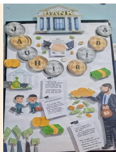
Gambar 4. Poster Menjauhi Riba

Poster di atas merupakan hasil karya kreatif siswa yang menggambarkan berbagai isu yang mereka ketahui di lingkungan sekitar. Hasil penelitian yang dilakukan oleh Susanto dan Radiallahunha menunjukkan bahwa siswa yang menggunakan media poster dalam pembelajaran tematiknya memperoleh nilai posttest yang lebih tinggi dibandingkan dengan siswa yang tidak menggunakannya. Penggunaan poster dalam proses pengajaran terbukti efektif dalam mendorong peningkatan kreativitas siswa dan membantu mereka memahami materi pelajaran secara lebih menyeluruh (Susanto & Radiallahunha, 2021)