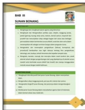
Gambar 3. Materi dan KI & KD