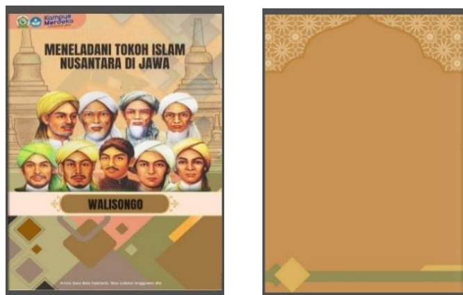
Gambar. 2 cover depan & belakang