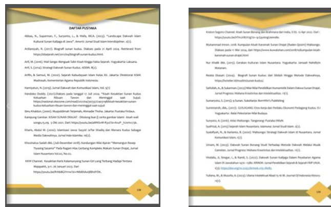
Gambar 7. Daftar Pustaka