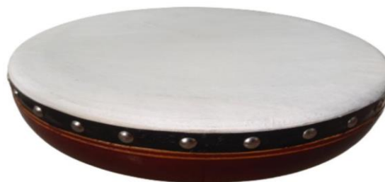
Gambar 4. Alat Musik Rebana.