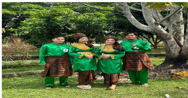
Gambar 7. Busana Penari Maanta.

Busana yang digunakan dalam pertunjukan tari Maanta yaitu busana tari melayu dengan ciri khas baju Panjang dang tengkuluk yang berwarna hijau yang melambangkan kegembiraan dan semarak di hari pernikahan. Pemain musik memakai kain batik jambi yang di buat oleh masyarakat provinsi jambi dan menggunakan baju putih.