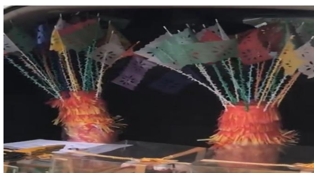
Gambar 5. Properti Bendera.