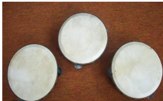
Gambar 2. Alat Musik Ski.