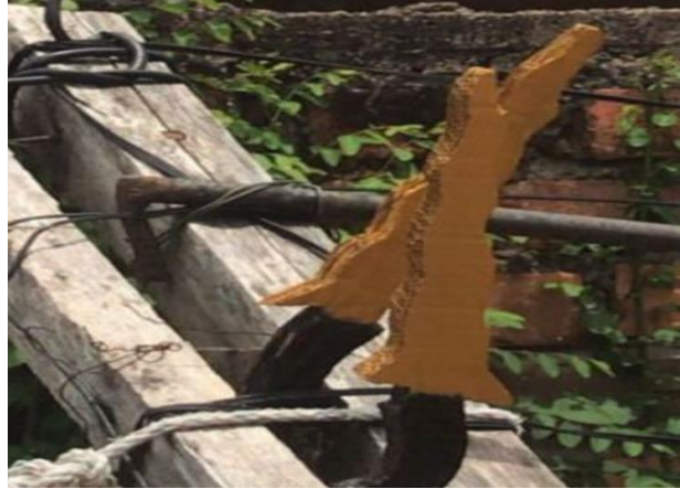
Gambar 6. Properti Kris