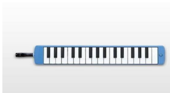
Gambar 3. Alat Musik Pianika.