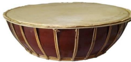
Gambar 1. Alat Musik Rebana.

Seni musik dimaknai sebagai salah satu cabang seni yang memanfaatkan bunyi. Tujuannya adalah, untuk mengekspresikan perasaan dari penciptanya. Seni musik pada umumnya juga diartikan sebagai ilmu dan seni dari paduan ritmis beberapa nada, vokal dan instrumental. Nada-nada atau vokal maupun instrumental ini melibatkan melodi dan harmoni untuk mengungkapkan apa saja yang mungkin tetapi khususnya bersifat emosional. Alat musik yang digunakan dalam tarian Maanta terdiri dari gendang, pianika, ski dan rebana yang digunakan sebagai pegiringan tarian Maanta.