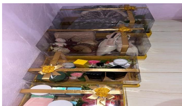
Gambar 4. Properti Box Hantaran.

Properti yang digunakan dalam tarian Maanta terdiri dari box hantaran pernikahan yang diberikan oleh laki-laki kepada mempelai wanita yang berisikan pakaian seperti, baju, sepatu, tas. Pehiasan seperti gelang, cincin dan kalung. Alat mandi dan lotian kecantikan dan seperangkat alat sholat sebagai isi dari box hantaran. Selain itu properti 2 bendera dan 2 kris.