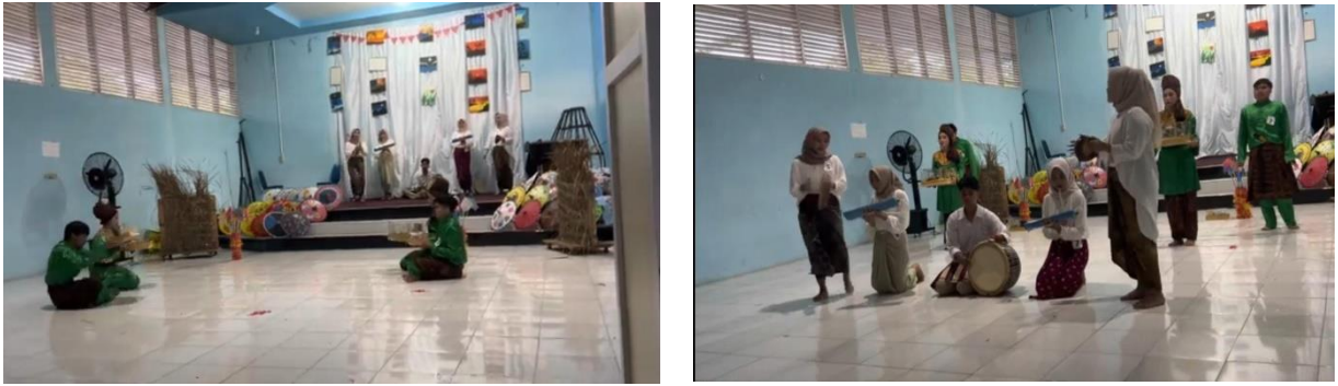
Gambar 9. Bentuk Penyajian Gerak Tari Maanta

Gerakan tari diawali dengan pembukaan persembahan dan dilanjutkan dengan arakan hantaran merupakan tanda jadi antara pemberian mempelai laki-laki kepada mempelai perempuan. Selanjutnya bendera yang diujung-ujung yang berisikan uang dengan berbagai nominal dari yang terendah hingga tertinggi. Selanjutnya Gerakan silek dan yang terakhir gerak berselimpuh yang merupakan prosesi dan bentuk dari menerima seserahan hantaran dan yang terakhir Gerakan persembahan penutup oleh penari dan pembawa musik.