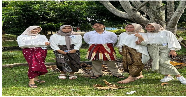
Gambar 8. Busana Pemain Musik Tari Maanta.