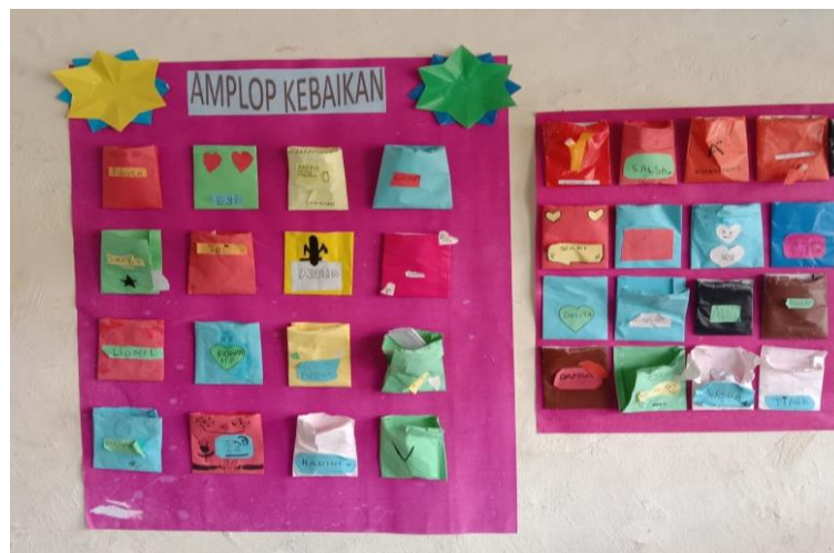
Gambar 1. Amplop Kebajikan

tersebut agar penilaiannya dapat lebih kompleks dan kompeten, dan untuk mengetahui sikap sosial dan spiritual siswa diluar lingkungan kelas maupun sekolah guru dapat bekerjasama dengan teman-teman dan orangtua, karena diluar lingkungan kelas dan sekolah teman dan orangtua lah yang lebih banyak berinteraksi dengan siswa. Dengan bekerjasama dengan orang-orang yang berada di sekita siswa diharapkan penilaian sikap yang diberikan guru berjalan secara maksimal dan kompeten. selain itu guru juga membuat media yang dapat mempermudah guru dalam melakukan penilaian sikap terhadap siswa.