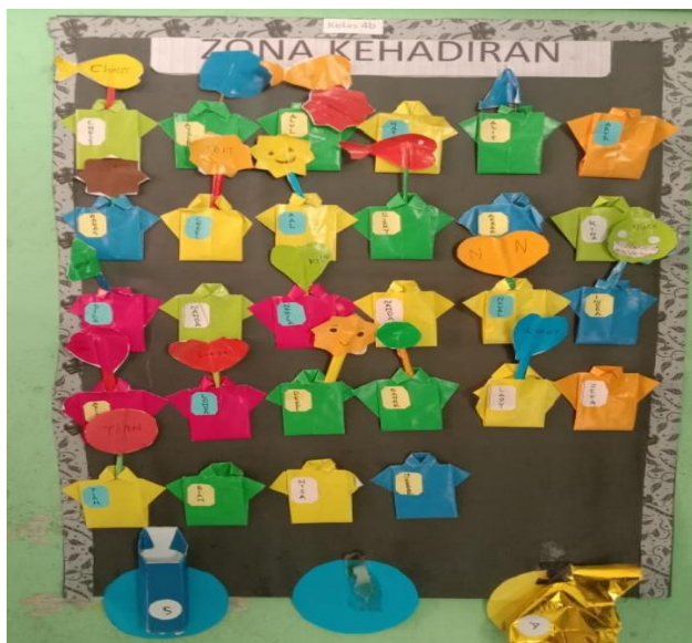
Gambar 2 Zona Kehadiran

Dengan media ini guru dapat mengetahui suasana hati murid-muridnya. Murid dapat meletakkan papan namanya sesuai dengan suasana hatinya masing-masing.