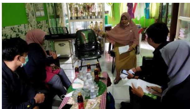
Gambar 2. Wawancara Bersama Guru Matematika

Beberapa kendala juga ditemui, seperti beberapa dari peserta didik masih ada yang pasif atau tidak berantusias dalam proses pembelajaran matematika secara daring, misalnya saat pembelajaran daring berlangsung peserta didik hanya melakukan absensi saja tanpa mengerjakan tugas matematika yang telah diberikan guru, selain itu kebanyakan peserta didik kurang memahami materi yang telah dijelaskan oleh guru, dan rata-rata jika peserta didik diberikan tugas oleh guru, peserta didik hanya mengirimkan ulang jawaban milik temannya. Selain itu, orang tua peserta didik ikut membantu menuliskan jawaban tugas yang telah diberikan guru.