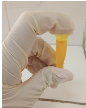
Gambar 2 Larutan Crude Enzim

Aktivitas enzim adalah besarnya kemampuan enzim dalam mengkatalisis reaksi penguraian sumber karbon. Aktivitas enzim dinyatakan dengan U/mL. Sedangkan aktivitas enzim spesifik dinyatakan dengan U/mg. Berdasarkan tabel diatas pada suhu 65°C menunjukkan hasil aktivitas enzim sangat tinggi, yaitu 0,593 U/mL. Dan nilai proteinnya lebih rendah dibanding aktivitas enzimnya yaitu 0,179 mg/mL, sehingga didapatkan nilai enzim spesifiknya sebesar 3,31 U/mg. Semakin tinggi nilai enzim spesifik maka semakin bagus kualitas dari enzim tersebut, hal ini sesuai dengan Agustini et al. , (2017) berpendapat bahwa aktivitas enzim spesifik mengindikasikan tingkat kemurnian enzim. Bisswanger (2014) menyatakan bahwa nilai aktivitas spesifik suatu enzim yang semakin besar menunjukkan bahwa semakin murni kadar enzim tersebut pada suatu larutan.