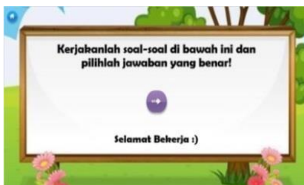
Gambar 5. tampilan soal evaluasi