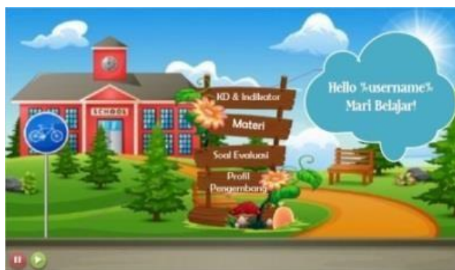
Gambar 2. Tampilan halaman utama media pembelajaran Articulate Storyline

Tampilan Kompetensi Dasar (KD) dan Indikator