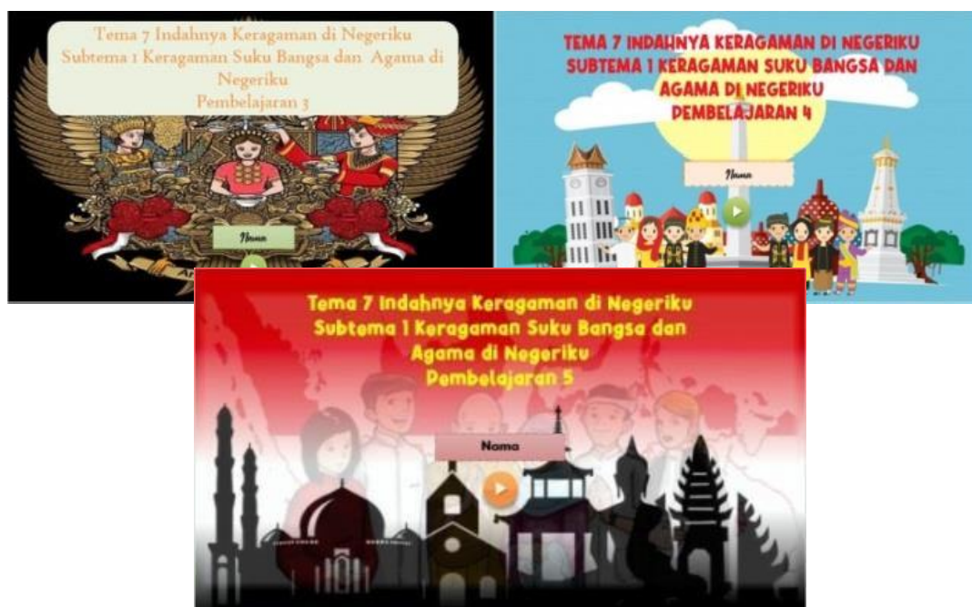
Gambar 1. Tampilan memulai media pembelajaran Articulate Storyline

Indahnya Keragaman Negeriku Subtema 1 Keragaman Suku Bangsa dan Agama di Negeriku Pembelajaran 4”. “Tema 7 Indahnya Keragaman Negeriku Subtema 1 Keragaman Suku Bangsa dan Agama di Negeriku Pembelajaran 5”.