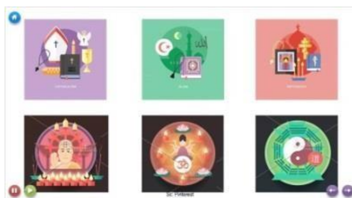
Gambar 4. Tampilan materi pembelajaran