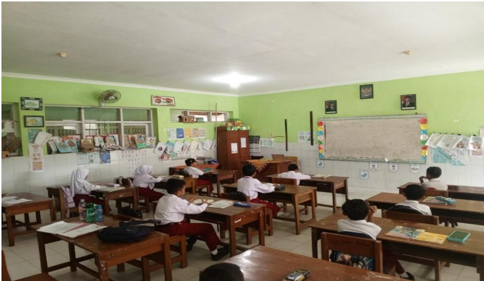
Gambar 2. Observasi saat proses pembelajaran menggunakan Model CIRC

Gambar 2 memperlihatkan situasi proses pembelajaran di kelas saat model Cooperative Integrated Reading and Composition (CIRC) diterapkan. Berdasarkan hasil observasi, kegiatan pembelajaran berlangsung secara tertib, terstruktur, dan kondusif. Siswa terlihat aktif bekerja dalam kelompok kecil dengan melakukan kegiatan membaca, mendiskusikan isi bacaan, serta menyusun hasil pemahaman secara bersama-sama.