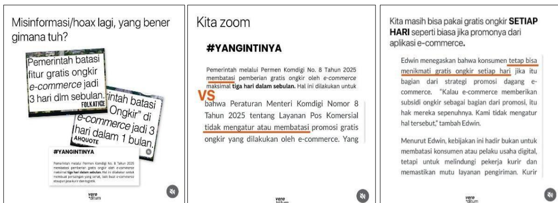
Gambar 2. Konten Kritik Akun @vereditum

Kasus pertama yang dikritik @vereditum adalah unggahan akun @ahqoute yang menyatakan 80% anak Indonesia tumbuh besar tanpa peran aktif seorang ayah. Setelah dilakukan proses verifikasi, akun @vereditum kemudian membuktikan bahwa informasi tersebut tidak sesuai dengan data resmi. Faktanya Kepala BKKBN mengatakan 20,9 persen kehilangan sosok ayah bukan 80 persen serta menambahkan bahwa saat ini anak tidak mendapatkan figur ayah disebabkan bersama ibunya 80%. Akun @vereditum memberikan klarifikasi dengan membuat konten kritik dilengkapi sumber terpercaya.