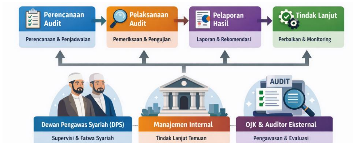
Gambar 1. Mekanisme Audit Syariah

Dari sisi audit dan penguatan jaminan kepatuhan, penelitian (S. Ayu et al., 2024) menegaskan audit syariah berperan menjaga integritas, transparansi, dan akuntabilitas, serta dapat meningkatkan kepercayaan nasabah ketika kerangka audit mencakup organisasi pengawasan, ruang lingkup, pelaporan, dan tindak lanjut. Berikut ini mekanisme audit syariah: