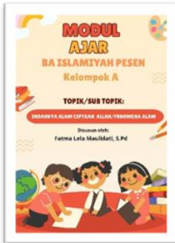
Gambar 2. Modul Ajar BA Islamiyah Pesen

Berikut adalah dokumentasi modul ajar yang telah dibuat: