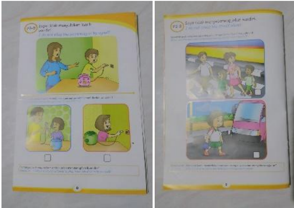
Gambar 7. Konsep kemandirian dengan bantuan orang dewasa

Terdapat sikap kemandirian sebagai berikut: saya tidak menyeberang sendiri, saya tidak menyalakan listrik sendiri, saya tidak menyalakan korek api sendiri, saya tidak memakai pisau tanpa pengawasan orang dewasa.