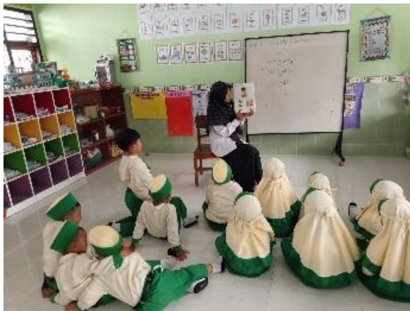
Gambar 3. Penyampaian materi dengan buku pilar

Hal tersebut juga didukung dengan hasil observasi yang telah peneliti lakukan bahwa guru terlihat menyampaikan materi pilar karakter dengan menggunakan buku pilar. (Observasi, 02 Juni 2025)