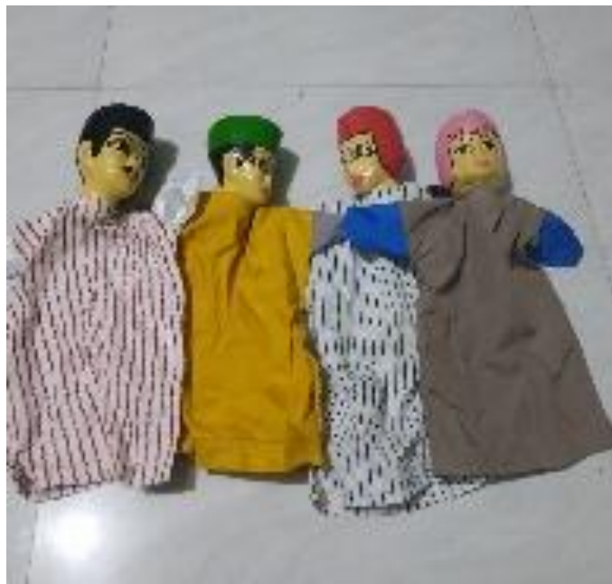
Gambar 9. Boneka tangan

Berikut adalah hasil dokumentasi boneka tangan yang digunakan untuk kegiatan Tell a story .