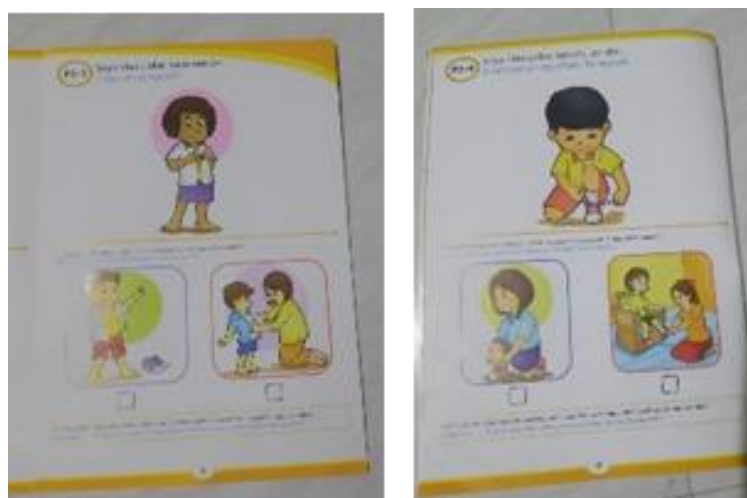
Gambar 6. Konsep kemandirian

Adapun sikap kemandirian sebagai berikut: saya bisa mandi sendiri, saya bisa makan sendiri, saya bisa pakai baju sendiri, saya bisa pakai sepatu sendiri.