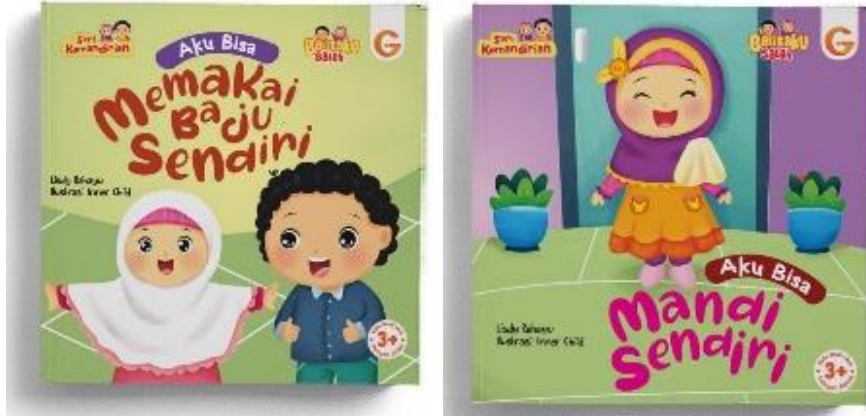
Gambar 8. Buku cerita

buku cerita dan boneka tangan. Hal tersebut diharapkan agar anak dapat memahami contoh sikap kemandirian yang terdapat dalam cerita tersebut, sehingga dapat diterapkan dalam kehidupan sehari-hari. Adapun buku cerita yang digunakan dalam kegiatan ini yaitu “Aku bisa pakai baju sendiri” dan “Aku bisa mandi sendiri”. (Observasi, 04 Juni 2025).