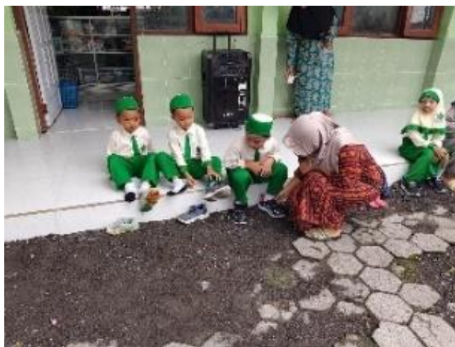
Gambar 4. Siswa dibantu melepas Sepatu

Dengan pentingnya penanaman karakter mandiri pada anak usia dini, guru perlu melakukan upaya-upaya agar anak dapat memiliki karakter mandiri tersebut. Berdasarkan hasil observasi yang telah dilakukan terdapat beberapa siswa BA Islamiyah Pesen yang sudah terlihat mandiri dan juga yang masih memerlukan bantuan. Terdapat beberapa siswa kelompok A yang sudah bisa membawa tas sendiri dan memakai sepatu sendiri. Namun, ada pula siswa yang masih dibantu memakaikan dan melepas sepatu dan juga tas yang dibawakan oleh orangtuanya seperti yang terdapat pada hasil dokumentasi berikut: (Observasi, 02 Juni 2025)