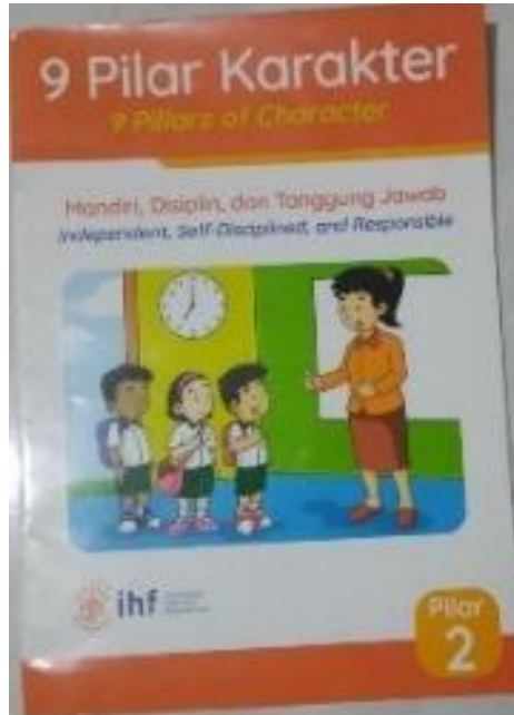
Gambar 5. Buku Pilar 2 (Mandiri, Disiplin dan Bertanggung jawab)

kegiatan ini dengan cara guru menjelaskan sikap-sikap yang terdapat dalam buku pilar kemandirian yaitu pilar 2. Tujuannya adalah agar anak dapat mengetahui dan memahami karakter yang diajarkan melalui gambar-gambar yang terdapat dalam buku 9 pilar karakter sehingga dapat tertanam dalam memori anak.