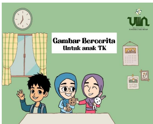
Gambar 2. Buku CerGam yang masih harus direvisi

Pada fase ini berawal dari mengancang-ancang kisi-kisi angket kemudian disusunlah angket hasil dari fase ini. Dimana dari fase ini angket validasi akan diberikan oleh pakar desain, praktisi dan pakar materi. Setelah penilaian yang diberikan para pakar pada angket yang sudah disebarakan sebelumnya didapatkan lalu bisa diketahui seberapa layak produk buku Cergam yang telah dirancang. Berikut merupakan gambar produk buku CerGam: