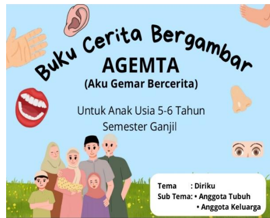
Gambar 3. Buku CerGam yang telah direvisi kembali