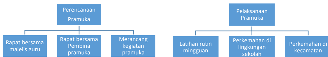
Gambar 1. Bagan pelaksanaan ekstrakurikuler pramuka di SDN 42 Korong Gadang

“...baris-berbaris membuat saya lebih percaya diri dan mau membantu teman...” (P05, Laki-laki, 11 tahun).