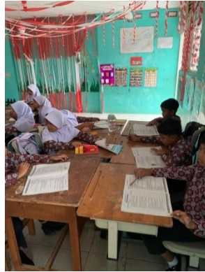
Gambar 2. Diskusi kelompok di kelas V SDN 42 Korong Gadang

Gambar 2 memperlihatkan suasana diskusi kelompok yang berlangsung di kelas V pada tanggal 18 September 2024. Dalam gambar ini, terlihat beberapa siswa duduk berkelompok dengan posisi saling berhadapan, aktif terlibat dalam percakapan dan tukar pendapat. Masing-masing anggota kelompok tampak fokus pada lembar kerja di tengah meja, menunjukkan bahwa mereka tengah menyelesaikan tugas bersama secara kolaboratif. Ekspresi wajah siswa yang tampak antusias dan penuh perhatian menunjukkan adanya semangat belajar yang tinggi dan rasa tanggung jawab terhadap pekerjaan kelompok. Situasi ini mencerminkan adanya hubungan sosial yang positif antar siswa, di mana mereka saling menghargai pendapat, memberikan kesempatan bicara, serta bekerja sama dalam mencapai tujuan bersama. Interaksi yang terbangun selama diskusi kelompok ini menjadi salah satu bentuk konkret dari perilaku prososial, seperti sikap tolong-menolong, kerja sama, serta empati terhadap teman sekelompok.