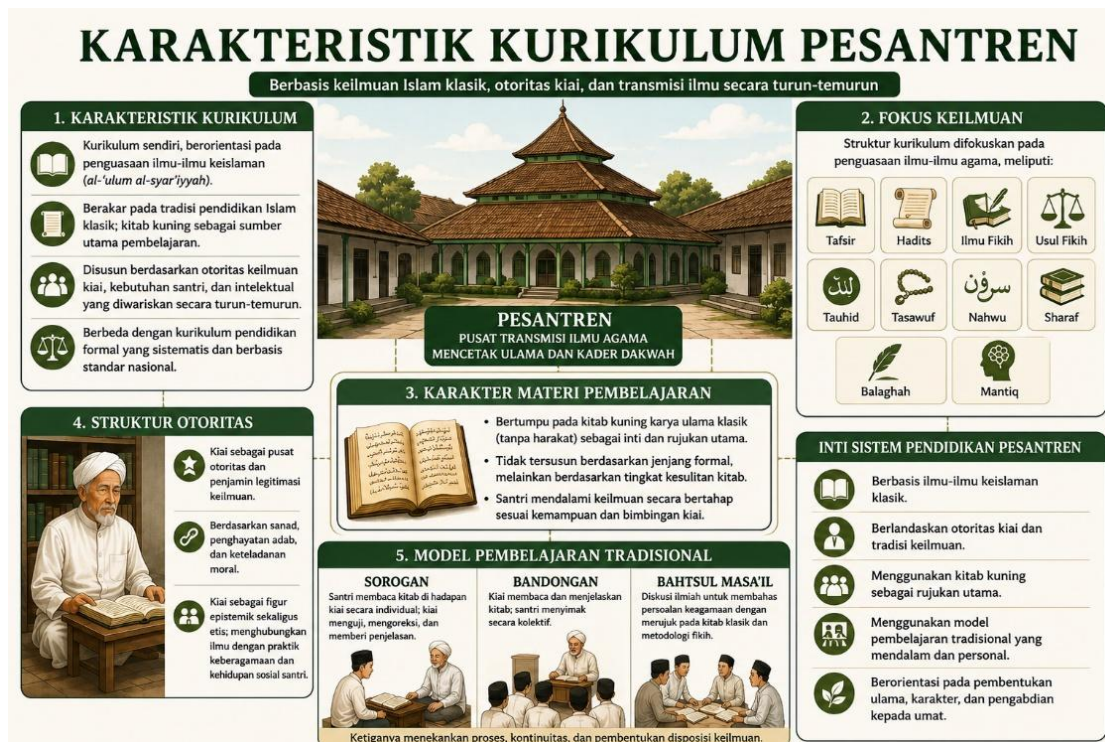
Gambar 1: Karakteristik Kurikulum Pesantren

Akan tetapi, dengan adanya arus modernisasi dan globalisasi di tengah masyarakat, kurikulum yang dipegang menghadapi tantangan yang kompleks seiring berkembangnya ilmu pengetahuan, teknologi informasi, dan kebutuhan dunia kerja. Hal itu mendorong pesantren untuk beradaptasi dengan memasukkan mata pelajaran umum dan keterampilan praktis. Meski begitu, tidak sedikit pesantren yang tetap mempertahankan kitab kuning sebagai inti kurikulum karena kurikulum tradisional dianggap sebagai identitas utama. Oleh sebab itu, perkembangan kurikulum pesantren saat ini lebih banyak mengarah pada model integratif yang berusaha menggabungkan kekuatan tradisi keilmuan klasik dengan kebutuhan pendidikan modern (Nafisah et al., 2026).