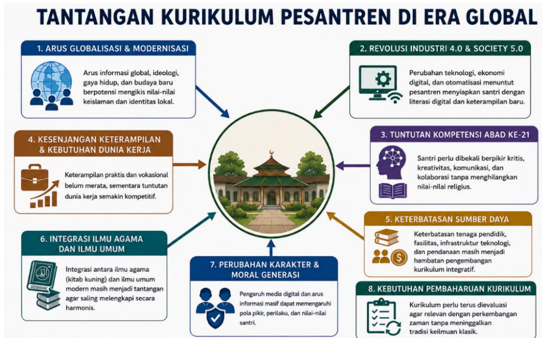
Gambar 2: Tantangan Pesantren di Era Modern

Oleh karena itu, transformasi kurikulum merupakan langkah yang strategis dalam berkontribusi secara lebih luas dalam kehidupan masyarakat modern (Azra, 2019). Yakni, adanya rancangan integratif agar santri mampu mengkaji persoalan modern berdasarkan nilai-nilai Islam dengan pendekatan ilmiah yang rasional. Sebagaimana dikatakan Syed Muhammad Naquib al-Attas, pendidikan Islam harus mampu menghasilkan manusia yang beradab ( insan adabi ), yaitu individu yang mempunyai keseimbangan dalam aspek spiritual, intelektual serta sosial (Al-Attas, 2014). Transformasi ini tentu bukan hanya sekadar perubahan materi pembelajaran, akan tetapi juga rekonstruksi paradigma pendidikan yang menghapus dikotomi antara ilmu agama dan ilmu umum.