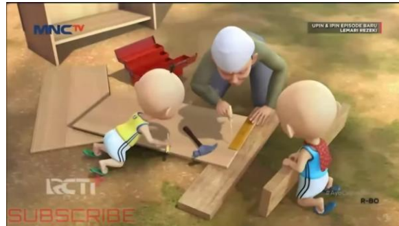
Gambar 2. Bentuk perilaku menolong (helping)

melalui interaksi suportif dengan Tok Dalang, seperti membantu memanen buah, membersihkan halaman, hingga merawat hewan peliharaan yang sakit. Pola hubungan sebab-akibat yang jelas dalam narasi visual menegaskan bahwa kesulitan yang dialami oleh figur dewasa di sekitar mereka selalu direspons secara protektif oleh karakter anak-anak, yang pada akhirnya membentuk pola asuh dan kebiasaan sosial yang positif.