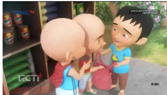
Gambar 3. Bentuk perilaku berbagi (sharing)

termaterialisasi dalam bentuk pembagian makanan saat jam istirahat atau bermain, yang digambarkan mampu mengesampingkan perbedaan latar belakang sosial-ekonomi anak.