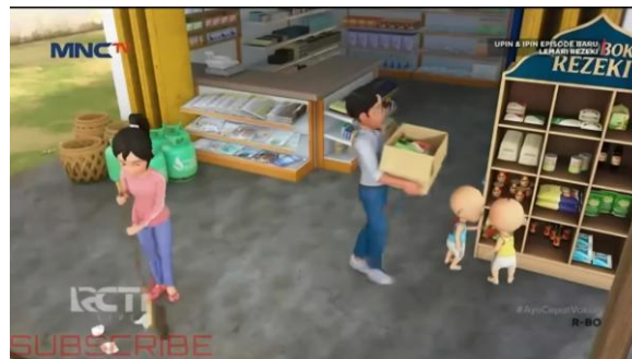
Gambar 4. Bentuk perilaku kerja sama (cooperating)

Sementara itu, pada aspek kerja sama ( cooperating ), perilaku pro sosial banyak terwujud melalui permainan tradisional (seperti teklek, kelereng, bentengan, dan membangun rumah pohon) serta respons kolektif saat menghadapi situasi krisis di kampung, seperti gotong-royong mencari ayam Rembo yang hilang atau membersihkan lingkungan pasca-hujan lebat. Melalui pembagian tugas yang adil secara spontan, anak-anak digambarkan mampu menekan ego individu demi mencapai tujuan kelompok, menyusun strategi bersama dengan komunikasi positif, serta merayakan hasil tanpa memicu konflik pertemanan.