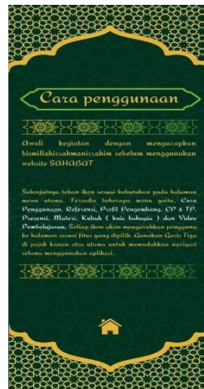
Gambar 2. Tampilan Cara Penggunaan