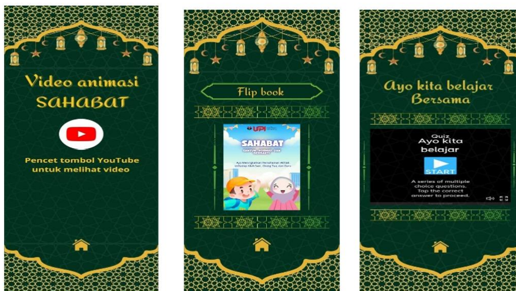
Gambar 4. Tampilan materi