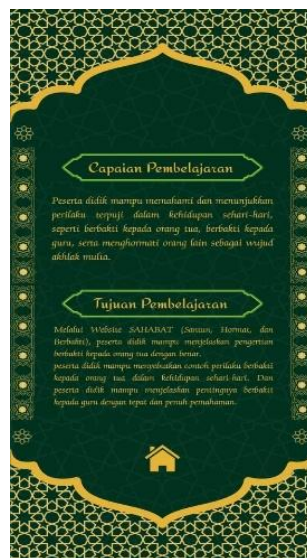
Gambar 3. Tampilan CP dan TP