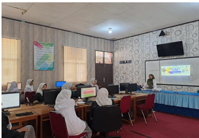
Gambar 3. Tanya jawab interaktif bersama para peserta

Proses produksi film merupakan kegiatan yang melibatkan kerja tim, sehingga secara tidak langsung melatih kemampuan kolaborasi siswa. Dalam kegiatan ini, siswa dibagi ke dalam kelompok-kelompok kecil yang bertugas mengembangkan ide dan memproduksi film secara bersama-sama. Hasil observasi menunjukkan bahwa siswa mampu bekerja sama dalam membagi peran, seperti penulis skenario, sutradara, kameramen, dan editor. Selain itu, siswa juga belajar berkomunikasi secara efektif dalam menyampaikan ide dan menyelesaikan masalah yang muncul selama proses produksi. Hal ini sejalan dengan konsep pembelajaran abad 21 yang menekankan pentingnya keterampilan 4C, yaitu critical thinking , creativity , collaboration , dan communication .