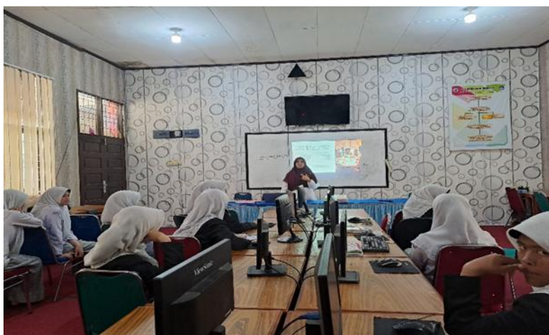
Gambar 1. Pemaparan materi menentukan ide dan konsep cerita

membangun landasan teoritis sebelum praktik dilakukan. Hasil observasi menunjukkan bahwa sebagian besar siswa awalnya belum memahami konsep dasar storytelling, seperti premis, konflik, klimaks, dan resolusi. Namun setelah diberikan pemaparan materi, siswa mulai mampu mengidentifikasi unsur-unsur tersebut dalam sebuah cerita serta mengaplikasikannya dalam ide film yang mereka kembangkan. Tanpa pemahaman naratif yang baik, film cenderung kehilangan arah dan pesan yang ingin disampaikan. Dengan demikian, kegiatan pelatihan ini tidak hanya memberikan pengetahuan baru, tetapi juga memperkuat kemampuan analisis siswa terhadap karya audiovisual.