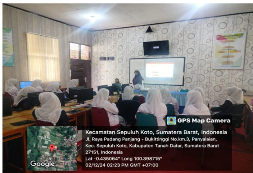
Gambar 4. Antusiasme siswa

Salah satu temuan penting dalam kegiatan ini adalah meningkatnya motivasi dan keterlibatan siswa dalam proses pembelajaran. Hal ini terlihat dari antusiasme siswa selama kegiatan berlangsung, terutama pada tahap praktik. Siswa menunjukkan minat yang tinggi dalam mengikuti setiap tahapan kegiatan, mulai dari diskusi hingga praktik produksi film. Bahkan, beberapa siswa menunjukkan inisiatif untuk mengembangkan ide cerita secara lebih mendalam di luar waktu kegiatan. Menurut John Dewey, pembelajaran yang efektif adalah pembelajaran yang melibatkan pengalaman langsung dan relevan dengan kehidupan siswa. Dalam konteks ini, film pendek sebagai media pembelajaran memberikan pengalaman yang kontekstual dan bermakna bagi siswa.