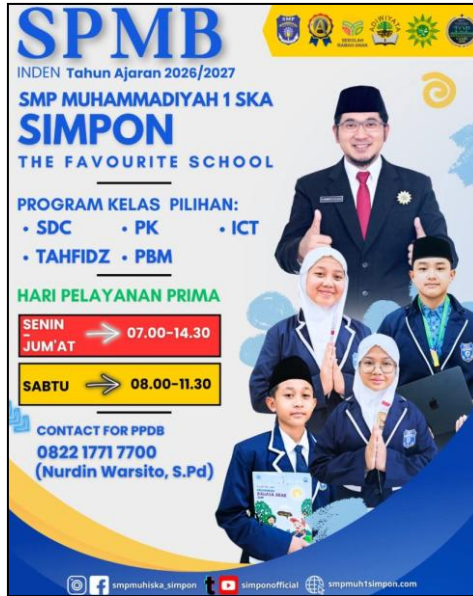
Gambar 1. Pamflet PPDB SMP MUH 1 SKA