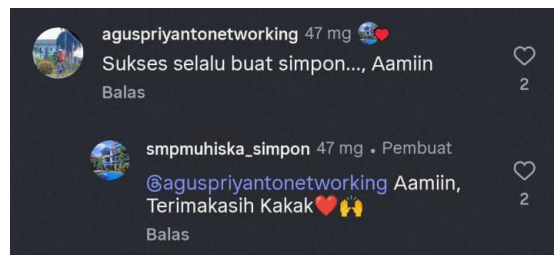
Gambar 4. Balasan komentar dari tim humas di Instagram resmi