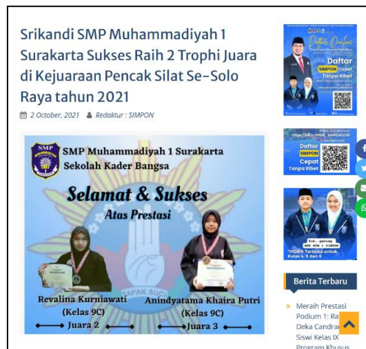
Gambar 2. Tampilan berita prestasi siswi di website resmi