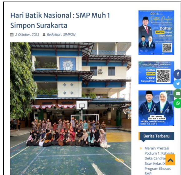
Gambar 3. Tampilan berita memperingati hari batik di sekolah