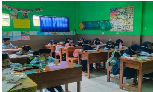
Gambar 1. Proses pembelajaran di kelas

Dari hasil tersebut, tim menyusun modul pelatihan yang berfokus pada peningkatan kemampuan membaca melalui metode Shared Reading dan Guided Reading, serta peningkatan keterampilan menulis menggunakan pendekatan Storytelling dan Creative Writing. Modul ini dilengkapi dengan permainan edukatif seperti Word Puzzle, Story Sequencing Cards, dan Tebak Kata Bergambar, yang kemudian diproduksi dalam bentuk cetak dan digital sederhana.