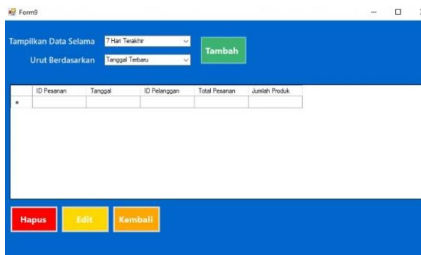
Gambar 6 Halaman Penjualan barang