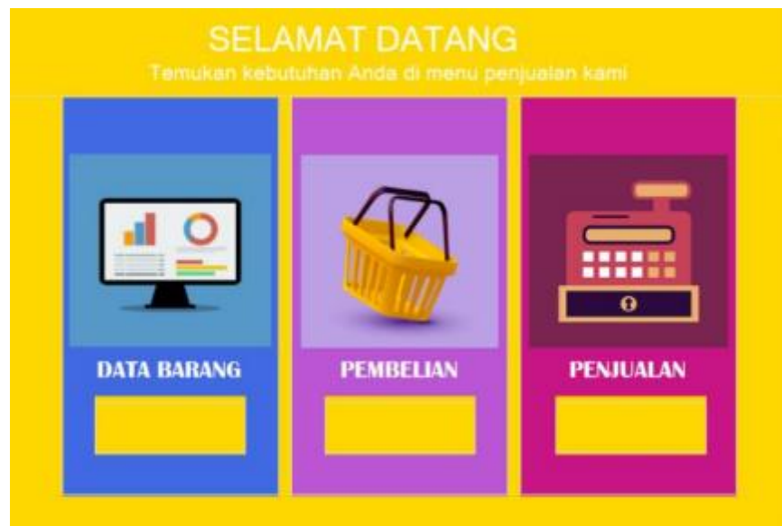
Gambar 3 Halaman Utama