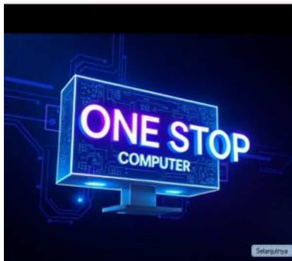
Gambar 1 Splash Screen

Halaman ini adalah halaman depan sendiri ketika aplikasi mulai di jalankan.