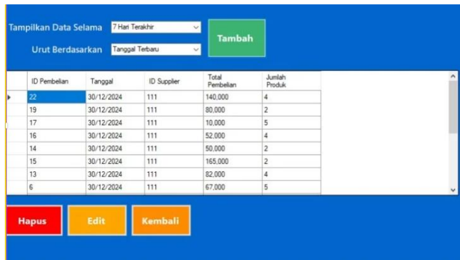
Gambar 5 Halaman Pembelian barang

Untuk melihat data pembelian barang, buka halaman data pembelian yang menampilkan transaksi dalam bentuk tabel. Pilih rentang waktu menggunakan dropdown " Tampilkan Data Selama " (misalnya, 7 Hari Terakhir ) dan urutkan data melalui dropdown " Urut Berdasarkan " (misalnya, Tanggal Terbaru ).