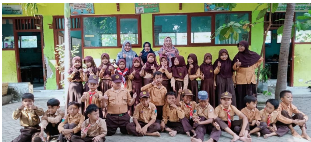
Gambar 4. Kegiatan Foto Bersama setelah selesai kegiatan