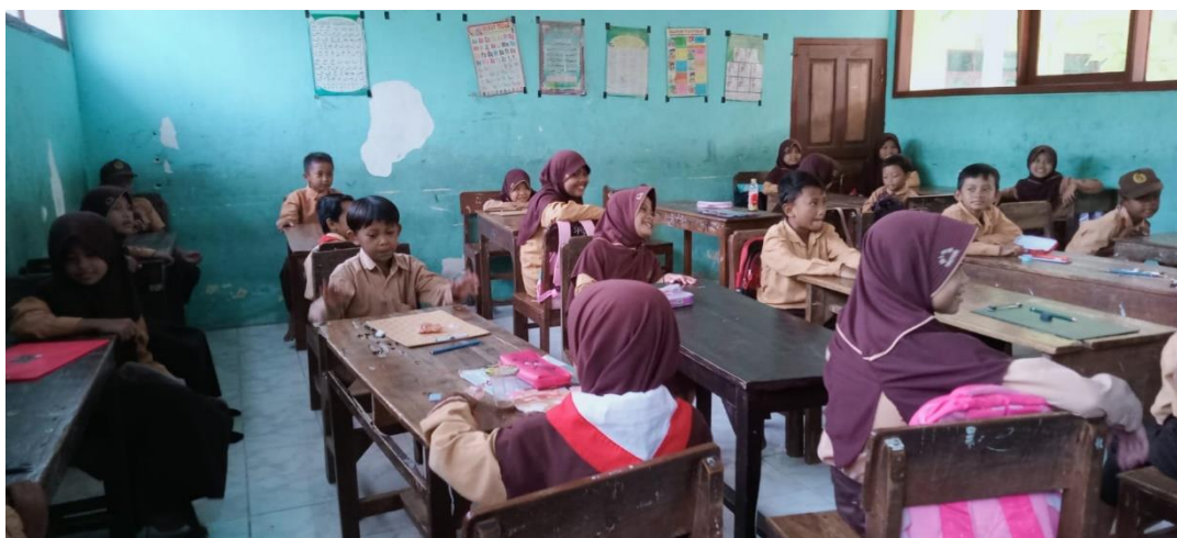
Gambar 3. Siswa menyimak dengan seksama