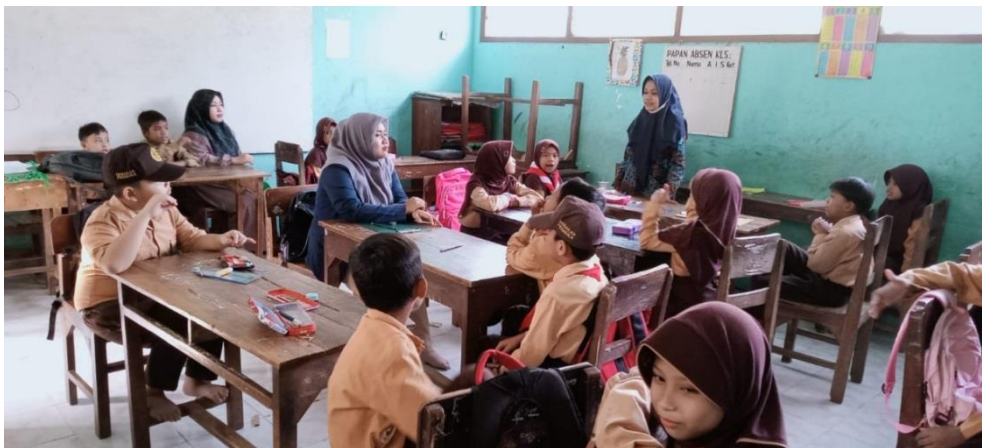
Gambar 2. Kegiatan pendampingan di kelas