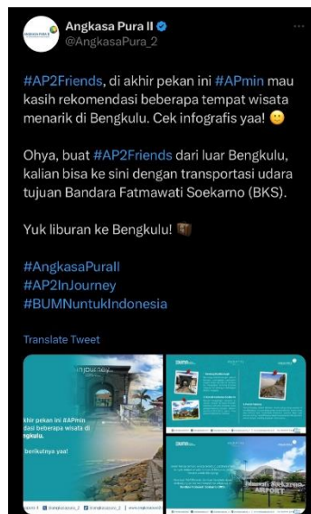
Gambar 7. Informasi mengenai Belitung

Dalam postingan yang diunggah pada 20 Oktober 2023 memiliki unsur mempengaruhi. Dikatakan dapat mempengaruhi karena PT. Angkasa Pura 2 selain memberikan informasi mengenai Belitung, mereka juga memberikan kalimat yang merujuk para penonton untuk ikut dalam merasakan keindahan Belitung. Dalam postingan tersebut PT. Angkasa Pura 2 memberi himbauan jika ingin berlibur ke Belitung, para penonton bisa mendapatkan informasi lebih lanjutnya dengan cara menekan akun yang di tag oleh PT. Angkasa Pura 2, yang berarti jika para penonton sudah menekan akun tersebut berarti sudah terpengaruh oleh ajakan PT. Angkasa Pura 2.