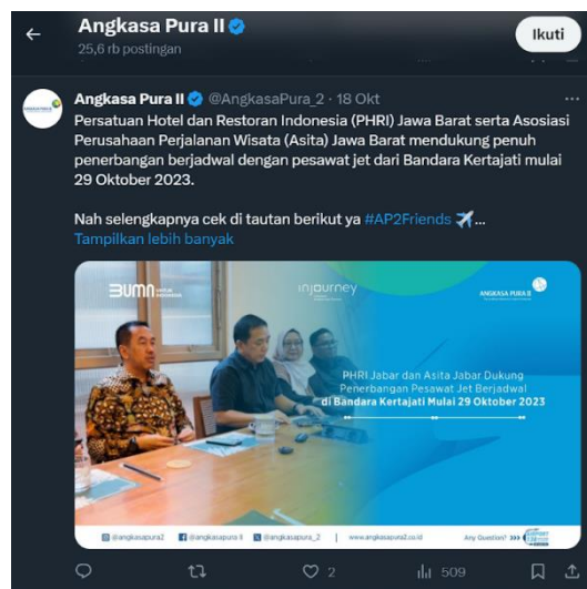
Gambar 4, Dukungan jadwal perjalanan menggunakan pesawat jet

Dalam twitt nya, sayangnya tidak terdapat banyak interaksi yang terjadi, padahal ucapan tersebut seharusnya bisa menarik perhatian warga Indonesia khususnya penggemar sepak bola. Postingan yang diupload pada tanggal 3 November 2023 ini hanya menghasilkan interaksi postingan ulang sebanyak 3 kali dan 4 likes saja, tidak ada komentar apapun yang terjadi didalamnya.