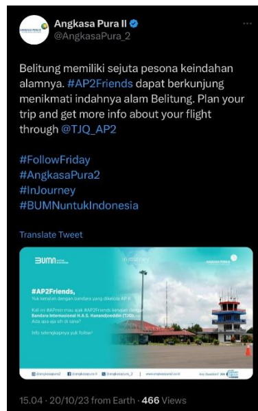
Gambar 6. Informasi mengenai Belitung

https://twitter.com/angkasapura_2/status/1720360441619292263?s=46