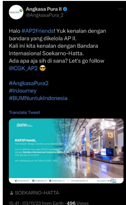
Gambar 8. Informasi mengenai pengenalan Bandara Internasional

https://twitter.com/angkasapura_2/status/1720360441619292263?s=46