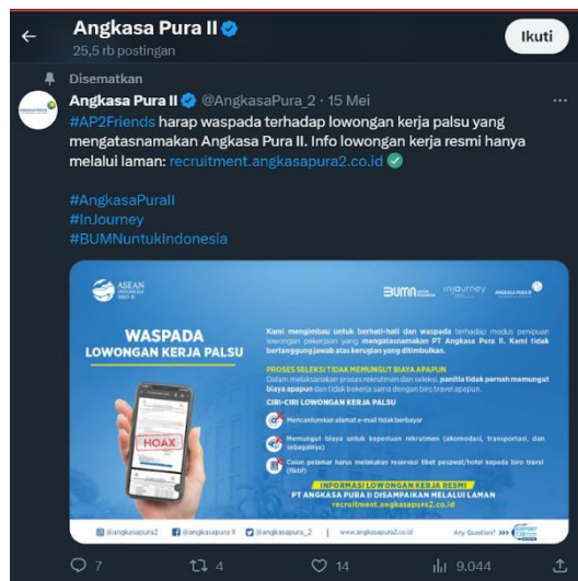
Gambar 1. Foto yang menunjukkan informasi himbauan lowongan pekerjaan palsu

Analisis isi dilakukan pada postingan twitter pada akun sosial media twitter Angkasa Pura II. Sebagian besar postingan yang diunggah memperoleh engagement dan interaksi sosial yang sedikit. Pada salah satu 1 postingan yang disematkan memperoleh cukup banyak tanggapan atau interaksi sosial yang diberikan oleh warganet, yaitu pada postingan himbauan lowongan pekerjaan palsu yang mengatasnamakan Angkasa Pura II. Secara rata-rata, postingan ini memperoleh 7 reply an (balasan tweet / thread), 4 retweet an (tweet orang lain yang kita posting kembali sebagai tweet kita sendiri), 14 likes, dan 9 ribu viewers. Dimana hal ini merupakan interaksi sosial terbanyak dibanding 10 postingan terakhirnya.