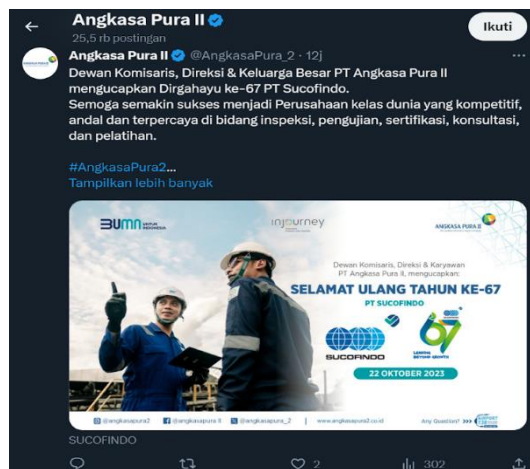
Gambar 2. Foto ucapan ulang tahun PT Sucofindo

https://x.com/AngkasaPura_2/status/1658041351039238145?s=20