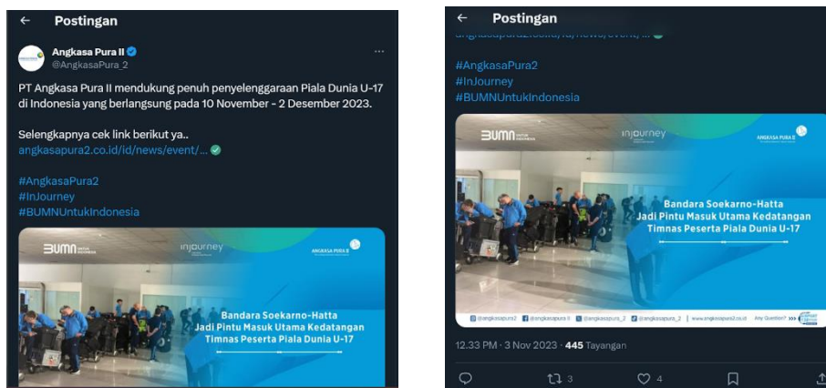
Gambar 3. Dukungan penyelenggaraan piala dunia U-17