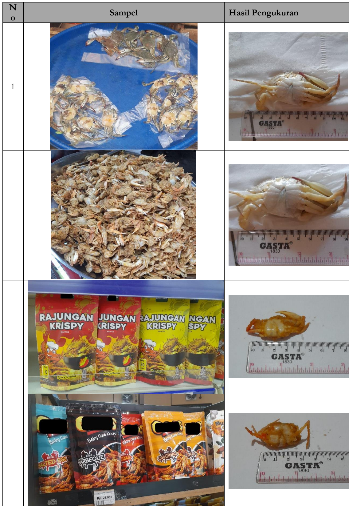
Tabel 1. Sampel dan Hasil pengukuran