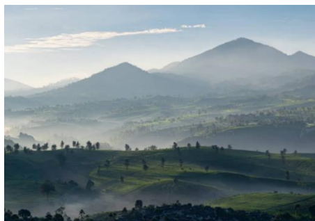
Gambar 2. Judul Foto : Pegalengan Bandung Tahun karya : 15 Desember 2020