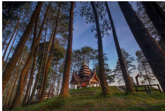
Karya 3. “ Wisata Puncak Pato ”

Dalam penciptaan karya pengkarya menggunakan kamera Fujifilm XT 20, lensa 10mm, ISO 100 , F/16 dan Shutter Speed 1Sec. Dalam pengambilan foto ini pengkarya juga menggunakan ND Filter. Penggunaan filter disini bertujuan untuk mengurangi cahaya yang over pada saat pengambilan foto dikarenakan menggunakan shutter speed rendah. Tahap terakhir setelah karya ini di foto pengkarya juga melakukan editing pada aplikasi adobe photoshop di kamera raw filter untuk mengedit warna, kontras, kecerahan, shadow dan cropping pada foto.