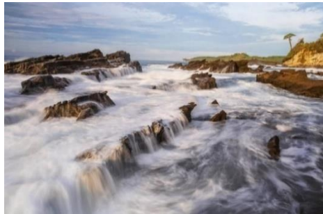
Gambar 1. Judul Foto : Pantai Sawarna Tahun Karya : 11 November 2021

Karya diambil di pantai Sawarna Kabupaten lebak, Banten. Merupakan karya dari Enche Tjin yang menampilkan seascape pantai Sawarna dengan menggunakan teknik slow speed dengan teknik pengambilan sama dengan perencanaan pengkarya. Sebagai perbedan karya Enche Tjin dari pengkarya adalah pengkarya akan mengambil beberapa objek wisata bahari seperti air terjun yang berada di wisata Luhak Nan Tigo.