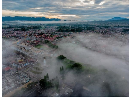
Karya 1. “ Cityscape Jam Gadang ”