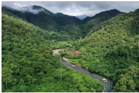
Gambar 3. Judul Foto : The Real Jungle