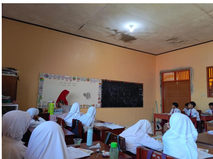
Gambar 2. Kegiatan pembelajaran di kelas VA

Peserta didik kelas VA itu sendiri ada beberapa yang belum menguasai keterampilan membaca dan menulis, sehingga guru harus memberikan perhatian khusus. Selain itu siswa juga belum menguasai kosakata Bahasa Indonesia yang baik dan benar. Permasalahan tersebut terjadi karena kurangnya latihan siswa untuk meningkatkan keterampilan membaca, menulis, serta menguasai kosakata bahasa Indonesia yang baik dan benar. Upaya yang telah dilakukan guru untuk mengatasi permasalahan tersebut adalah memberikan tambahan jam untuk belajar membaca dan menulis, dan itu juga menyesuaikan waktu kosong yang dimiliki oleh guru. Gambar berikut menunjukkan kegiatan pembelajaran di kelas VA: