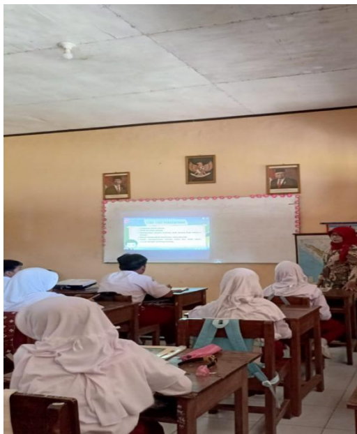
Gambar 3. Kegiatan pembelajaran di kelas VB

Pelaksanaan kurikulum merdeka tentunya memiliki konsep tersendiri dalam penerapannya, salah satunya yaitu mengurangi beban guru. Sedangkan dalam kegiatan pelaksanaan kurikulum merdeka pada pembelajaran Bahasa Indonesia di SDN 1 Tambaksogra terlihat tidak mengurangi beban guru, karena dalam pembelajarannya masih menggunakan cara lama seperti metode ceramah yang berpusat pada guru. Seharusnya pada kurikulum merdeka siswa dianjurkan untuk aktif dalam kegiatan pembelajaran, sedangkan guru hanya membimbing dan mengawasi. Hal tersebut sesuai seperti yang dinyatakan oleh Dzaky et al., (2020) bahwa peran guru yang selama ini sebagai satu-satunya penyedia ilmu akan sedikit tergeser karena di masa mendatang peran dan kehadiran guru di ruang kelas akan semakin menantang. Oleh karena itu guru perlu melakukan inovasi-inovasi untuk meningkatkan kegiatan pembelajaran. Inovasi-inovasi bertujuan untuk menjadikan peserta didik lebih aktif dan semangat dalam belajar, sehingga materi yang disampaikan guru dapat diterima dengan baik dan prestasi belajar Bahasa Indonesia peserta didik juga akan meningkat.